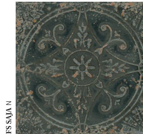
FS SAJA N