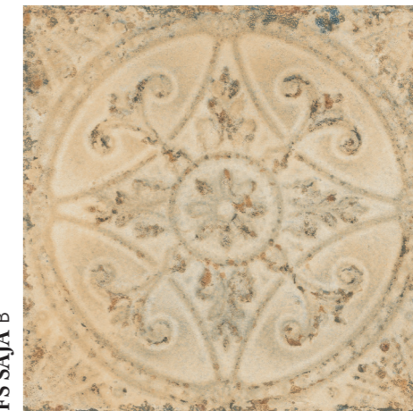
FS SAJA B